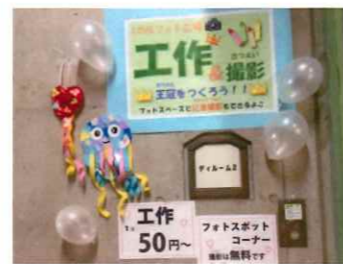
こさく LOVEフォトプロジェクト (工作)