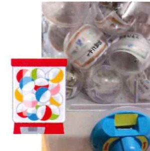
ちいき くさぶえ (地域ガチャ)