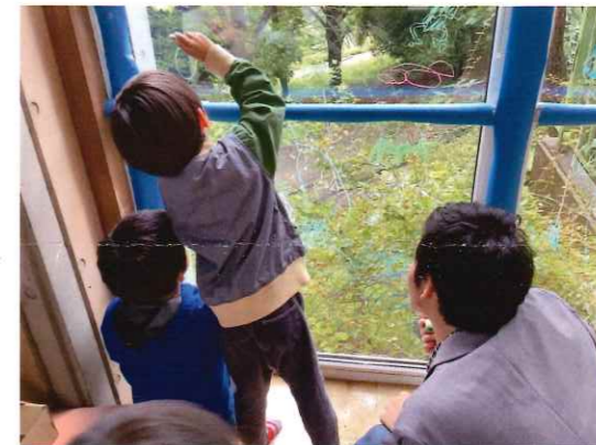
ちいきくんれんかい 地域訓練会バナナのおうち・とまとのおうち (ミニバザー・シールラリー・まどにおえかき)