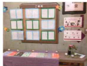
いずみ しょうどうてん 泉 (書道展)