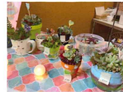
たにくしょくぶつ よう はんばい (多肉植物寄せ植え販売)