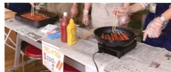
リリーフ・ネット