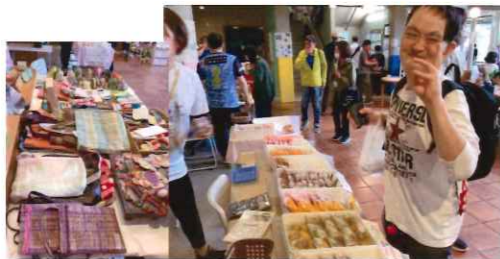
や がし お くさぶえ (焼き菓子・さをり織り)