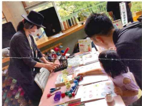
じしゅせいひんはんばい かん さくせい アスタPC (自主製品販売 缶バッヂ作成)

ちいき かた しゅってん ちいき し 地域の方も出店され、地域に知っていただける大変よい機会となったと思います。ありがとうございました。