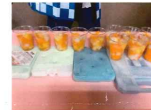
むら チャコ村 (フルーツポンチ)