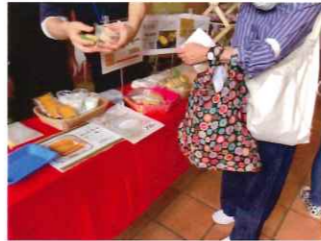
しゃ か し さくひんはんばい かたるべ社 (お菓子・作品販売)