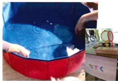
たすく (めだかすくい)