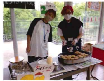
はんばい この や くさぶえ (ドリンク販売・お好み焼き)