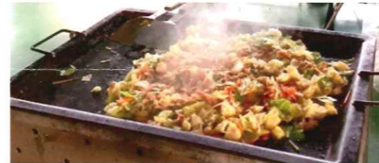
つだちく 都田地区 やきそば