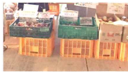
じものうか しんせんやさい 地元農家さんの新鮮野菜