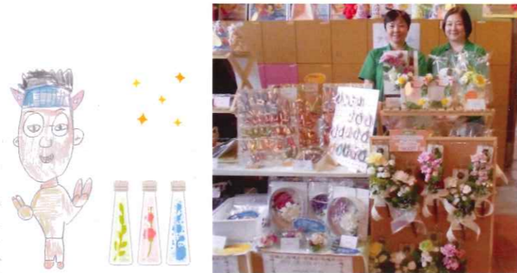
アモリアル (ハーバリウム・リボンレイ)