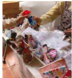
でんわ てつく しゅげい いのちの電話 (手作り手芸)