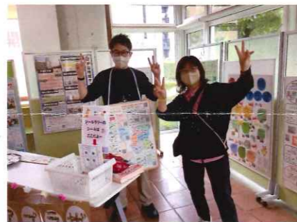
つづきくないちいき 都筑区内地域ケアプラザ (パネル展示)