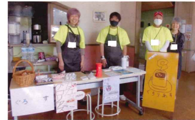
カフェぐろりあす