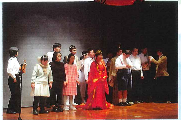
つづきアート&ミュージック・ネクスト 2018年横浜市歴史博物館講堂にて